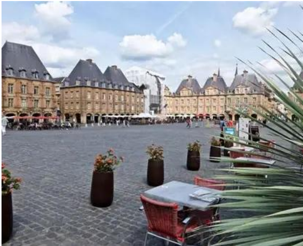
Place Ducale, Charleville

minder ver komt. Totaal roeien we 160 km en passeren 30 sluizen. We verblijven in hotels, de eerste drie dagen in het Kyriad Charleville Mezière, redelijk basaal, maar schoon en dicht bij het stadscentrum, het Place Ducale. Vervolgens verblijven we twee dagen in Les Sorbiers in Hastière. Een mooi en romantisch hotel in een kasteelvilla aan de Maas en omringd door bossen. De laatste twee nachten zijn we in Namen in het luxe Mercure hotel, liggend aan de Maas dicht bij het stadscentrum. Onze tocht begint in Sedan, bekend om het Kasteel van Sedan, het grootste militaire fort van Europa. Helaas geen tijd voor een bezoek, want hier gaan de boten in het water en roeien we