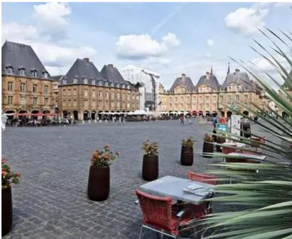
Place Ducale, Charleville

Vervolgens de dag erna via Monthermé naar Laifour. Op de derde dag verkassen we van hotel en roeien we naar Fumay. De vierde dag heeft een bijzonder karakter, de roeitocht gaat Ham sur Meuse door twee tunnels met een totale lengte van 600 meter! We leggen aan in Givet onder het, door Karel V gebouwde Fort Charlemont. De vijfde dag gaat de bagage mee naar Namen, passeren we de Belgische grens en komen we langs het toeristische Dinant om te stoppen in Anhée. De laatste dag bereiken we Namen en leggen afhankelijk van het weer vóór of ná de stad aan, waar de boten uit het water gaan.